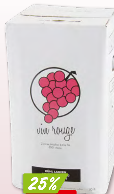
Valdepeñas Tempranillo Cabernet Sauvignon Pata Negra DO 2022, 6 x