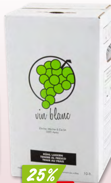
Chardonnay Hess Select 2022 6 x