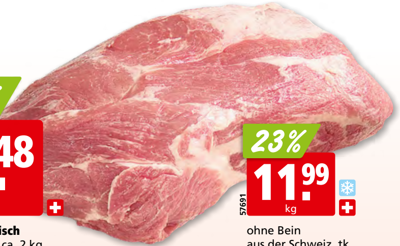
Schweinhals frisch aus der Schweiz, ca. 2 kg