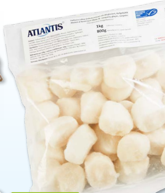
Atlantis Jakobsmuscheln, 10-20 ohne Rogen, MSC, aus den USA, tk