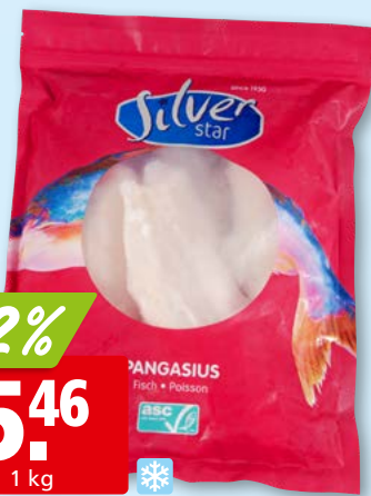
Silver Star Pangasiusfilets nature, 110-170 g ASC, tk, 10 x