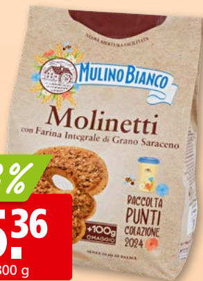
Mulino Bianco Molinetti