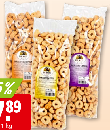
Zii Mati Tarallini Classici, alla Cipolla oder Gusto Pizza