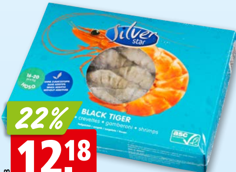
Silver Star Krevetten Black Tiger, 16-20 ASC, tk, 10 x