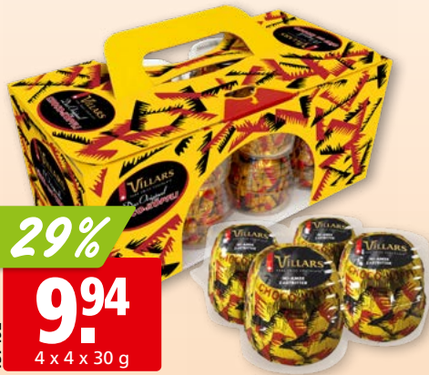
Villars Schoko-Köpflli Original