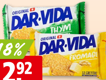
Dar-Vida Crackers extra fein mit Käse oder Thymian/Salz, 10 x