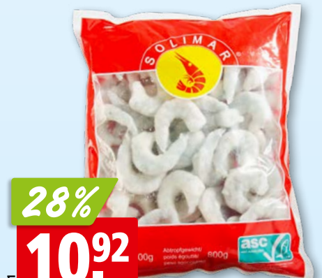
Solimar Krevettenschwänze Vannamei, 16-20 geschält, ASC, tk, 10 x