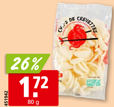
Joya de Nicaragua Cabinetta Robusto