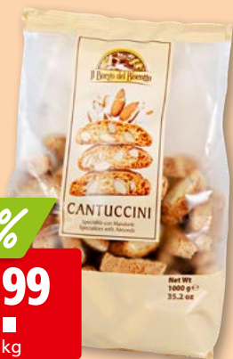
Il Borgo del Biscotto Cantuccini