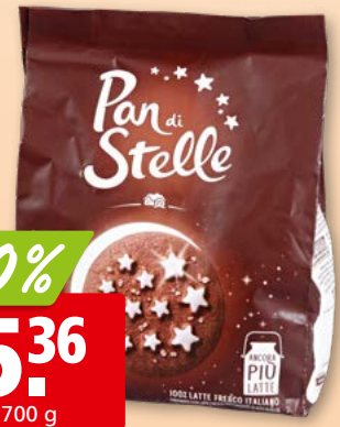
Mulino Bianco Pan di Stelle