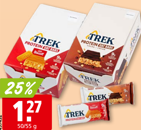
Trek Proteinriegel Biscoff Lotus oder Kakao 16 x