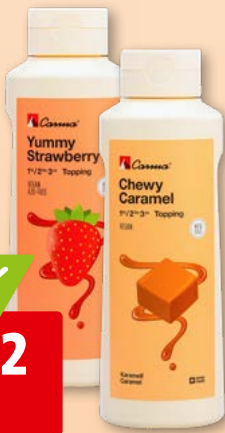
Carma Topping Karamell oder Erdbeer, 6 x