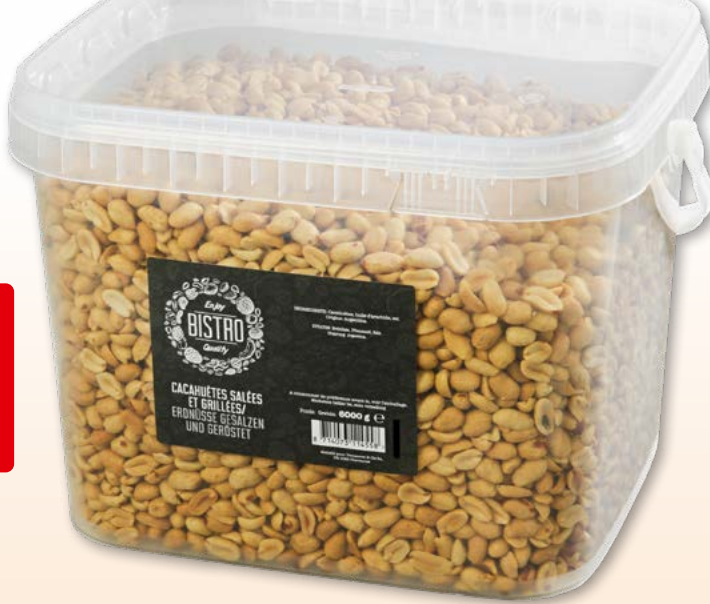
Bistro Erdnüsse geröstet und gesalzen