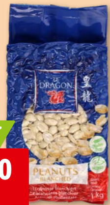
Le Dragon Erdnüsse blanchiert