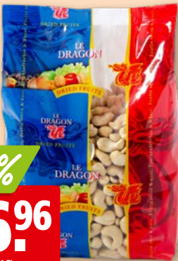
Le Dragon Cashewkerne