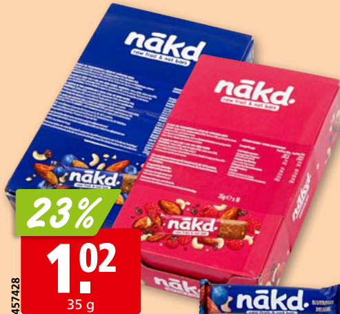
nākd. Delight Berry oder Blueberry 18 x