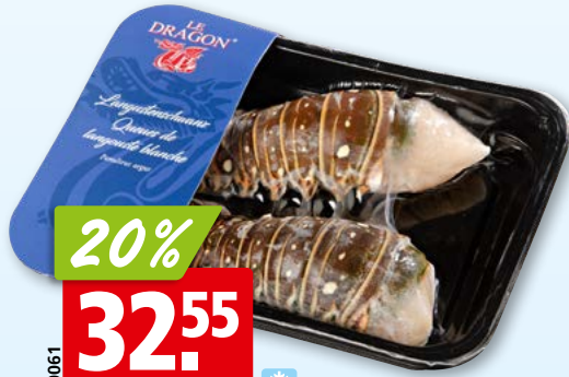
Le Dragon Langustenschwänze tk