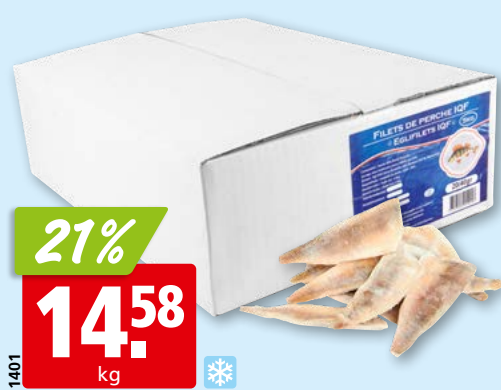
Eglifilets IQF, 20-40 mit Haut, tk, 5 kg