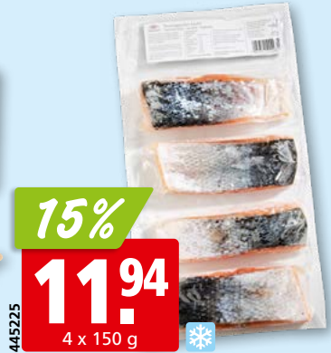
Lachsportionen mit Haut, aus Norwegen, tk, 12 x