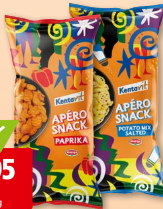
Kentavit Apéro-Snack Paprika oder Potato Mix Salted