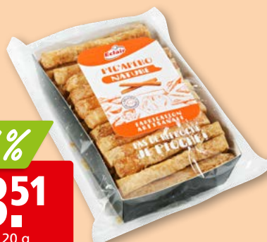
Eclair Pic'Apéro nature