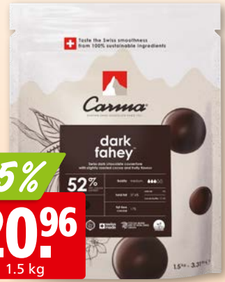
Carma Couverture Dark Fahey 52%