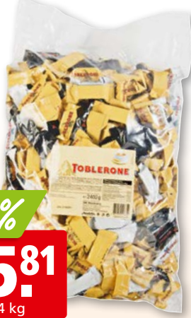
Toblerone Mix, ca. 300 Stück