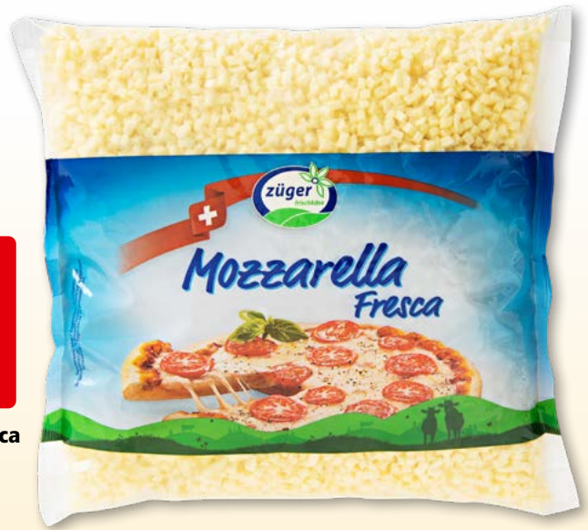
Züger Mozzarella Fresca gerieben, 5 x 2 kg