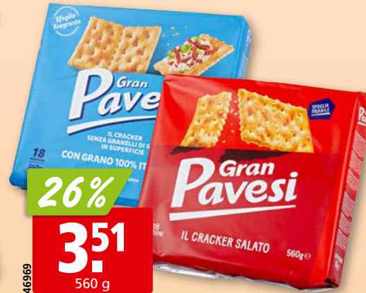
Gran Pavesi Crackers mit oder ohne Salzkörner