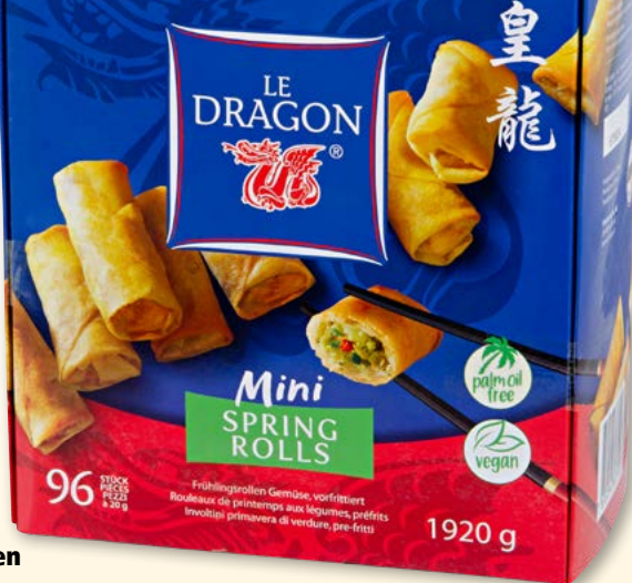
Le Dragon Mini-Frühlingsrollen mit Gemüse, tk