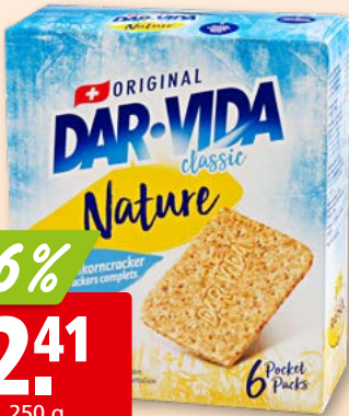
Dar-Vida Classic nature 4 x