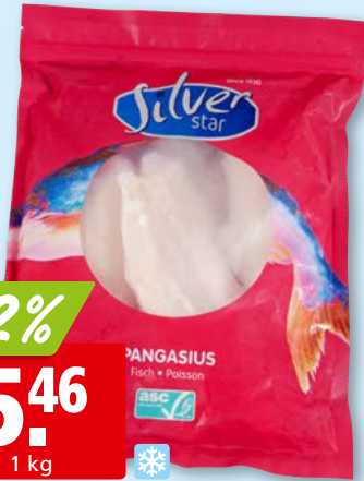
Filets de pangasius Silver Star, 110-170 g ASC, surg., 10 x