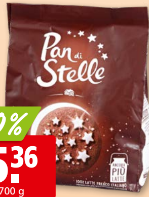
Pan di Stelle Mulino Bianco