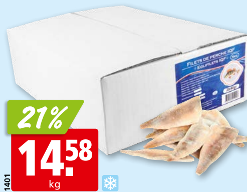
Filets de perche IQF, 20-40 avec peau, surg., 5 kg