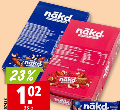
Delight nākd. berry ou blueberry 18 x