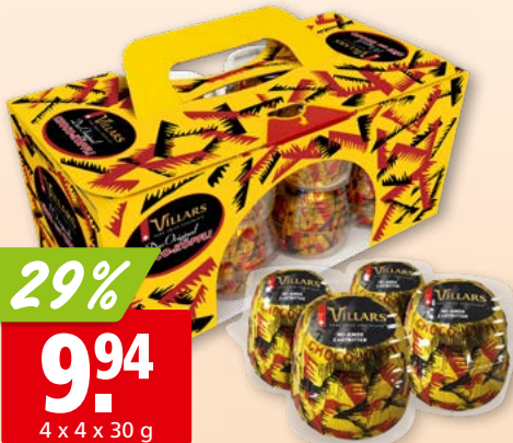
Têtes au choco original Villars