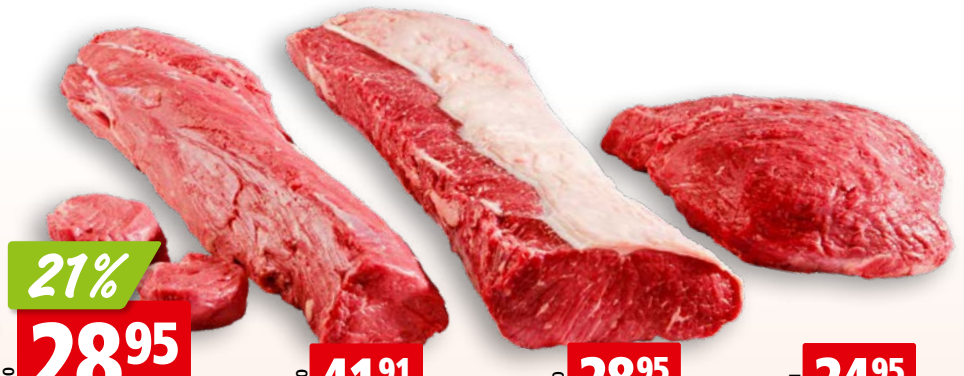
Cœur de filet de bœuf frais d'Australie