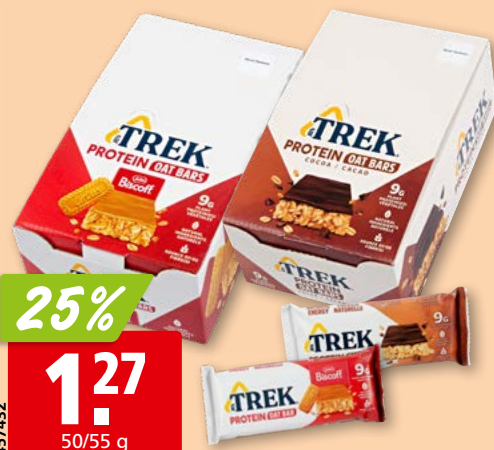
Barre protéinée Trek biscoff lotus ou cacao 16 x