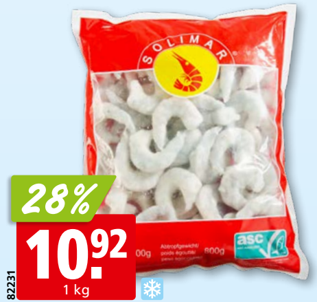
Queues de crevettes Vannamei Solimar, 16-20 décortiquées, ASC, surg., 10 x