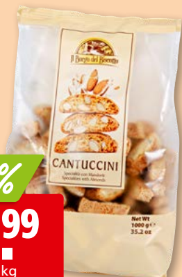
Cantuccini Il Borgo del Biscotto