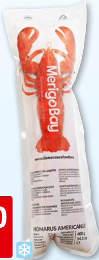
Homard Aquashell cuit, MSC, surg.