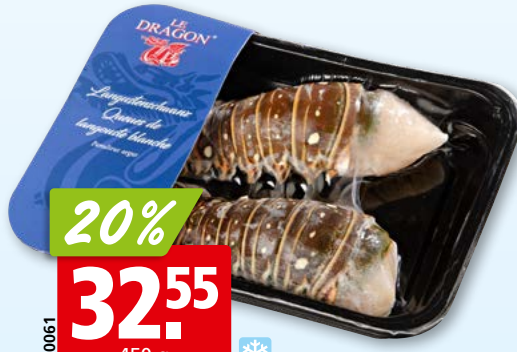
Queues de langouste Le Dragon surg.