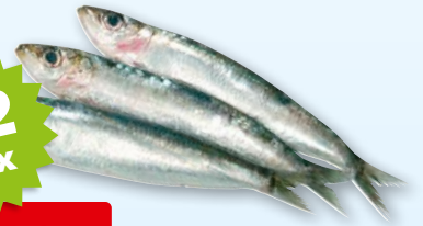
Sardines fraîches de l'Atlantique Nord-Est