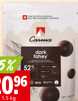
Couverture dark fahey Carma 52%