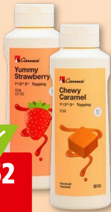
Topping Carma caramel ou fraise, 6 x