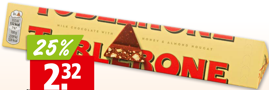
Toblerone au lait 5 x