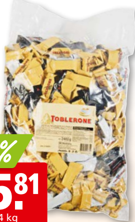
Toblerone mix, env. 300 pièces