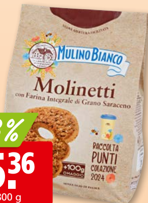
Molinetti Mulino Bianco