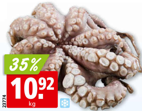
Poulpe, 2-3 kg surg.