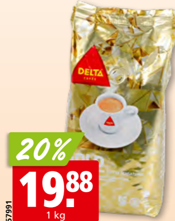
Delta Kaffeebohnen Gold