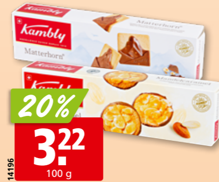
Kambly Biscuits Mandelcaramel oder Matterhorn, 3 x