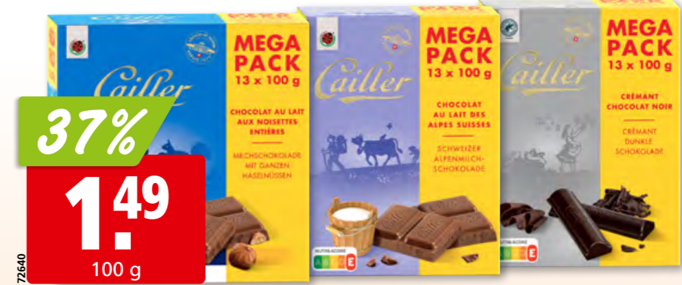
Cailler Schokolade Megapack, Milch & Haselnüsse, Milch oder Crémant, 13 x