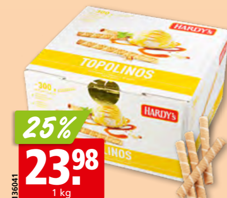
Hardy's Topolinos ca. 300 Stück