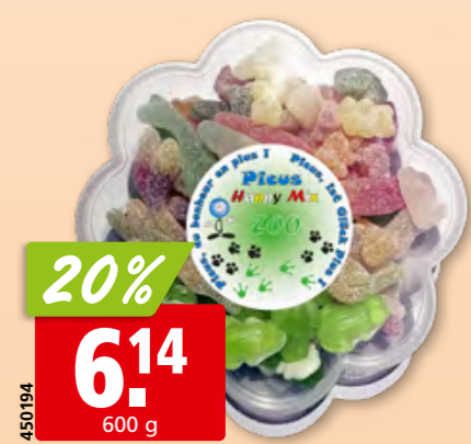
Picus Happy Mix Zoo