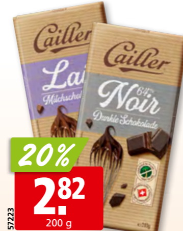
Cailler Kochschokolade dunkel 64% oder Milch, 18 x