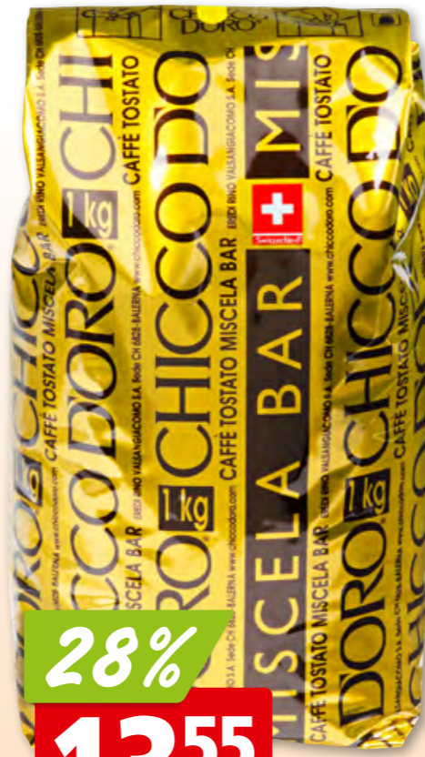
Chicco d'Oro Kaffeebohnen Miscela Bar 10 x