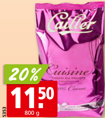
Cailler Kakaopulver Cuisine