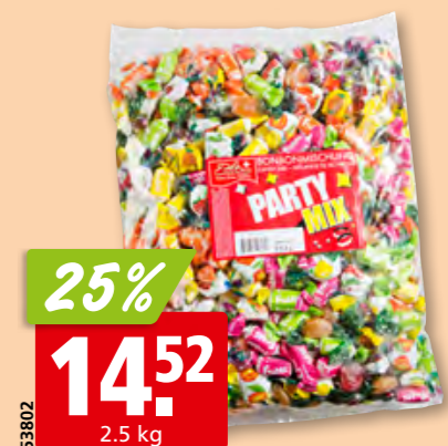
Zile Party Mix