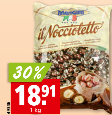
Mangini Il Nocciotetto