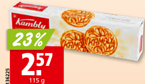
Kambly Bretzeli 3 x