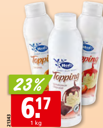
Hero Topping Schokolade, Caramel oder Erdbeer 6 x