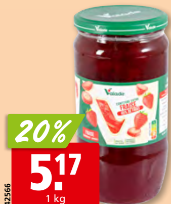
Valade Erdbeerkonfitüre extra 45%