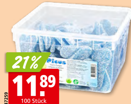
Picus saure Zungen blau