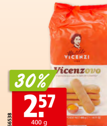
Matilde Vicenzi Vincenzovo Savoirdi 3 x