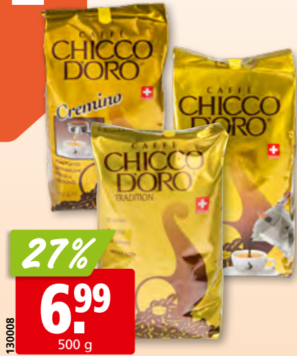
Chicco d'Oro Kaffee Tradition Bohnen oder gemahlen oder Cremino gemahlen, 6 x

Genf 022 308 60 20 Chavannes 021 633 36 00 Sitten 027 327 28 50 Matran 026 407 51 00