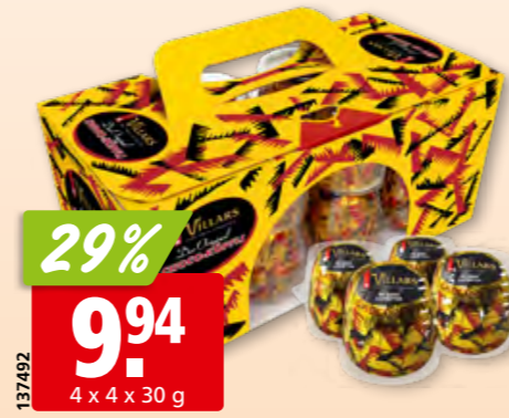
Villars Schoko-Köpflli Original