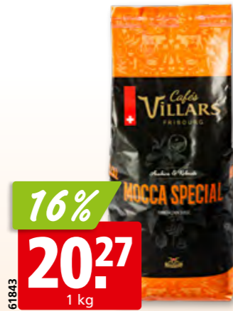
Cafés Villars Kaffeebohnen Mokka Spezial