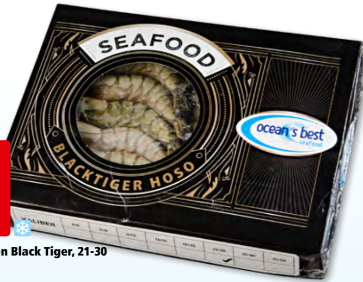
42755 Ocean's Best Krevetten Black Tiger, 21-30 tk, 10 x