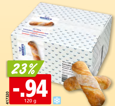
417320 Romer's Schrauben-Sandwiches hell tk, 10 x