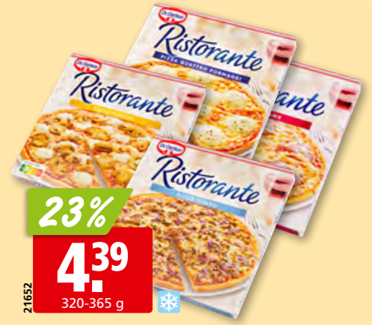
21652 Dr. Oetker Pizza Ristorante diverse Sorten, tk