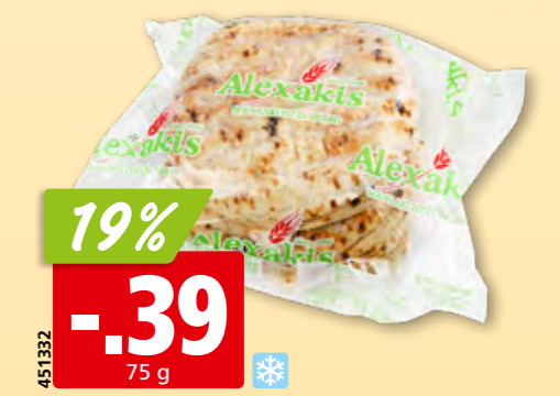
451332 Alexakis Pita-Brot tk, 10 x