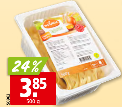
50962 Pastinella Tagliatelle, 6 mm