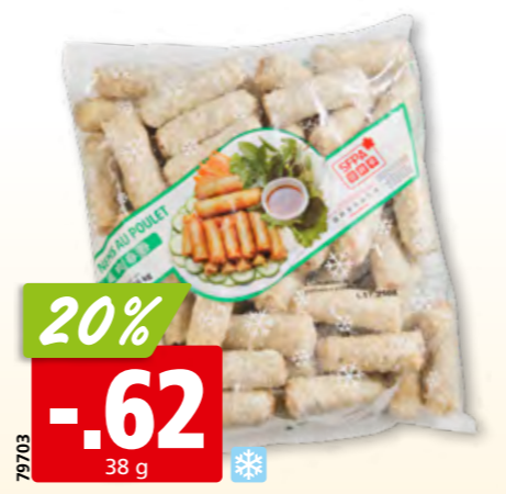
79703 SFPA Nem mit Pouletfleisch tk, 50 x