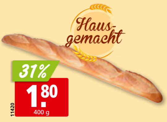
11420 Baguette Parisette aus unserer Hausbäckerei