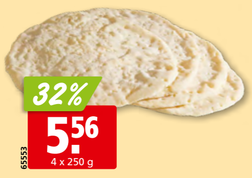
65553 Padula Basis für Pizza