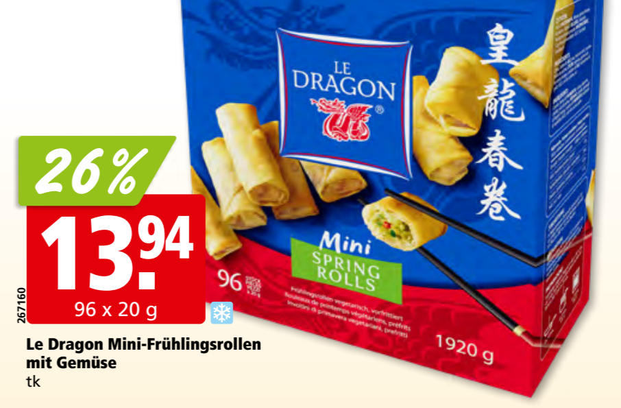
267160 Le Dragon Mini-Frühlingsrollen mit Gemüse tk