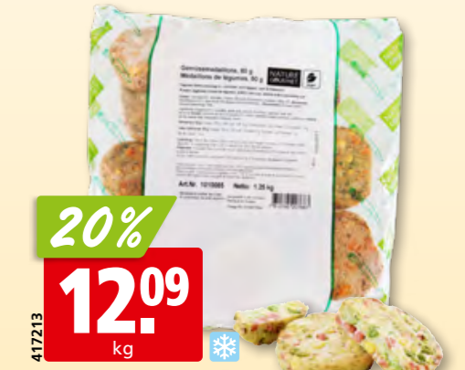
417213 Nature Gourmet Gemüsemedaillons, 80 g tk, 1.25 kg