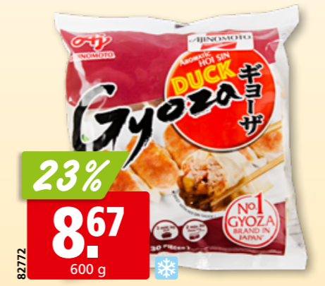
82772 Ajinomoto Gyoza Potsticker mit Ente 30 Stück, tk