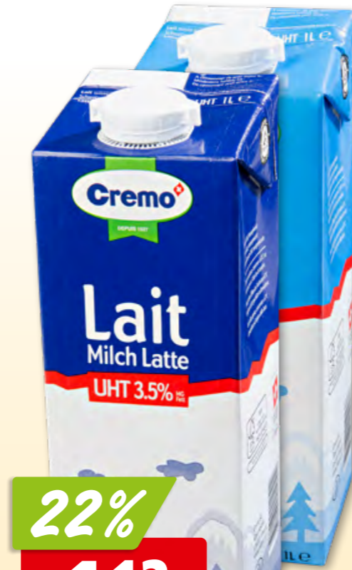
Cremo Vollmilch UHT 3.5% oder 1.5% Fett, 12 x