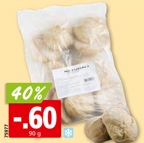
75977 Brötchen da Avó tk, 10 x