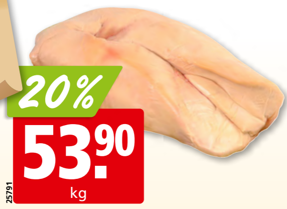
25791 Enten-Foie gras 1. Wahl frisch roh, aus Frankreich (entädert: 57.90/kg)

Genf 022 308 60 24 Chavannes 021 633 36 04 Sitten 027 327 28 54 Matran 026 407 51 19