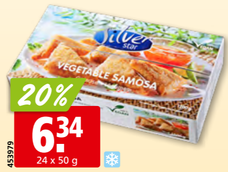
453979 Silver Star Samosas mit Gemüse tk