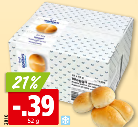
2810 Romer's Weggli gebacken, tk, 25 x