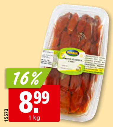
15573 Renna getrocknete Tomaten im Öl, 4 x