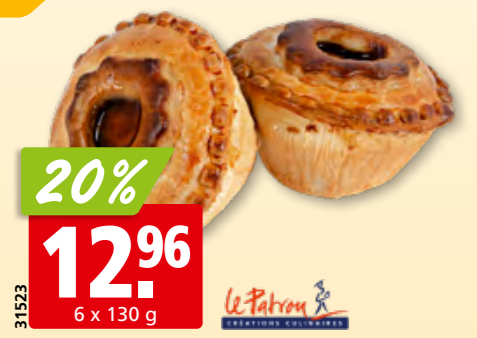
31523 Le Patron Waadtländer Pastetli