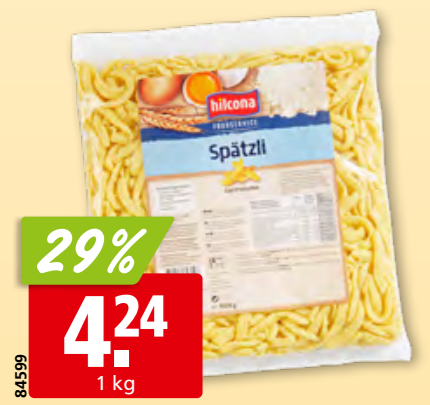
84599 Hilcona Spätzli Gastronomie 19% Eier