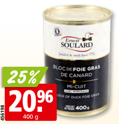
456198 Enten-foie gras mit 30% Stücken halbgekocht