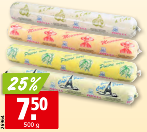
26964 Pepi's Sauce Gastro diverse Sorten