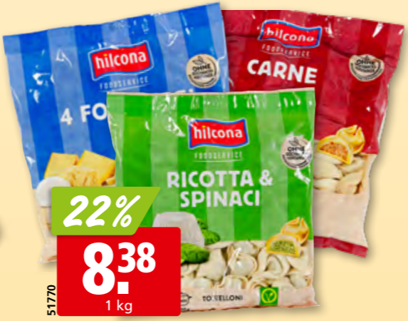
51770 Hilcona gefüllte Pasta diverse Sorten