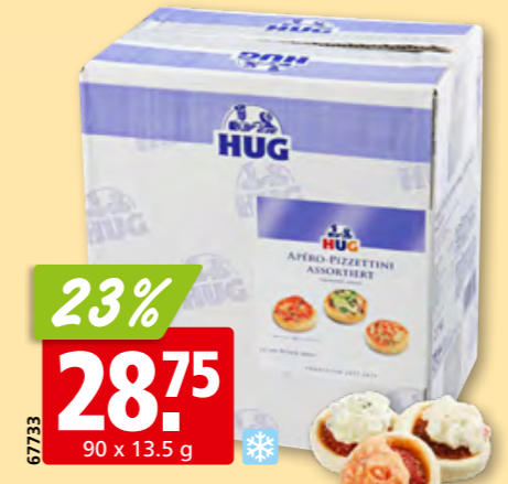
67733 Hug Apéro-Pizzettini assortiert, tk