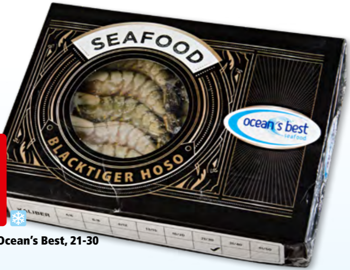
Crevettes Black Tiger Ocean's Best, 21-30 surg., 10 x