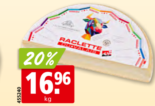
Raclette du Valais AOP Bagnes Valdor rond, 1/2, env. 2.5 kg