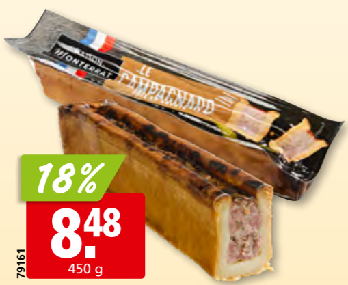
18% 8.48 450 g Pâté cocktail campagnard Maison Monterra