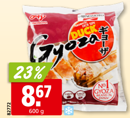
23% 8.67 600 g Gyoza Potsticker au canard Ajinomoto 30 pièces, surg.