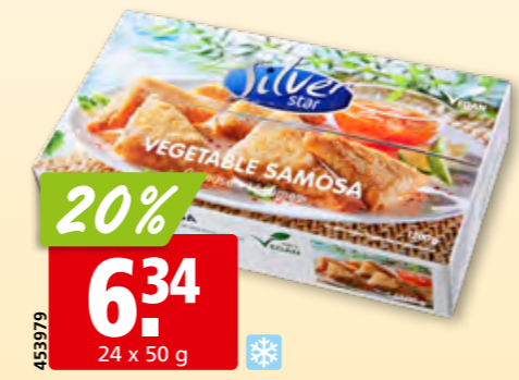
20% 6.34 24 x 50 g Samosas aux légumes Silver Star surg.