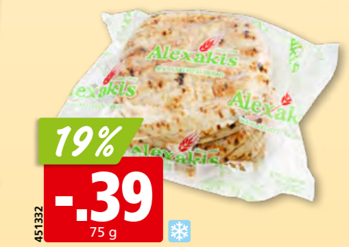
19% -.39 75 g Pain pita Alexakis surg., 10 x