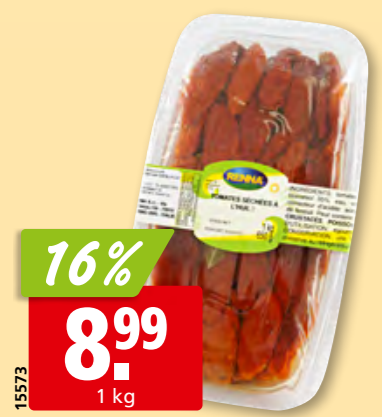
16% 8.99 1 kg Tomates séchées Renna à l'huile, 4 x