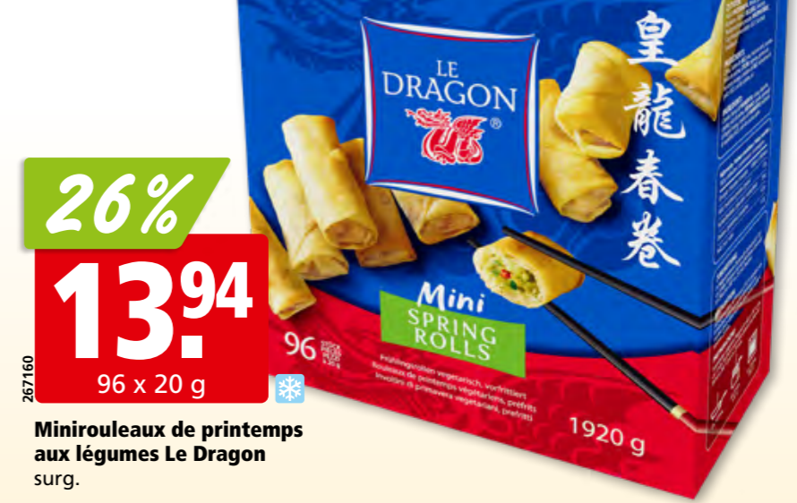
26% 13.94 96 x 20 g Minirouleaux de printemps aux légumes Le Dragon surg.