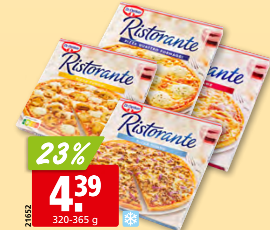
23% 4.39 320-365 g Pizza Ristorante Dr. Oetker diverses sortes, surg.