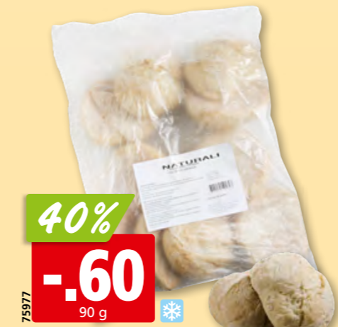
40% -.60 90 g Ballon da Avó surg., 10 x