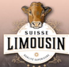
Palette de bœuf frais de Suisse/Allemagne/Autriche