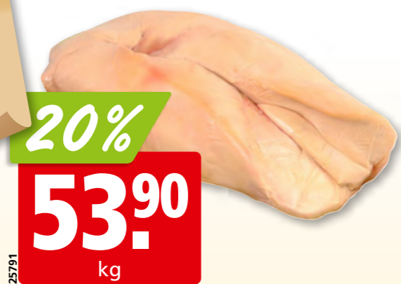
20% 53.90 kg Foie gras de canard 1 er choix frais cru, de France (déveiné: 57.90/kg)

Genève 022 308 60 24 Chavannes 021 633 36 04 Sion 027 327 28 54 Matran 026 407 51 19