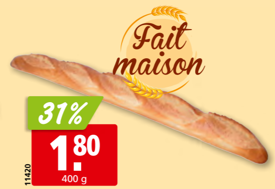
31% 1.80 400 g Baguette parisette de notre boulangerie artisanale