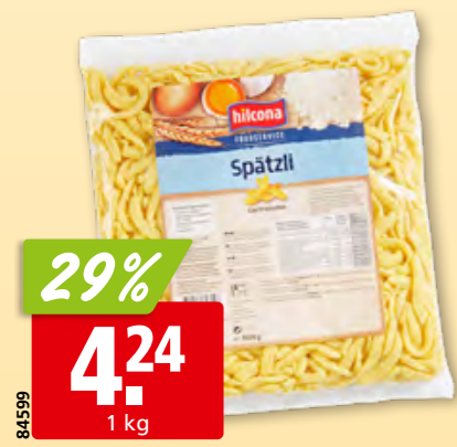
29% 4.24 1 kg Spätzli Gastronomie Hilcona 19% d'œufs