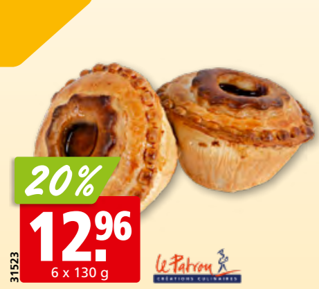
20% 12.96 6 x 130 g Pâtés vaudois Le Patron