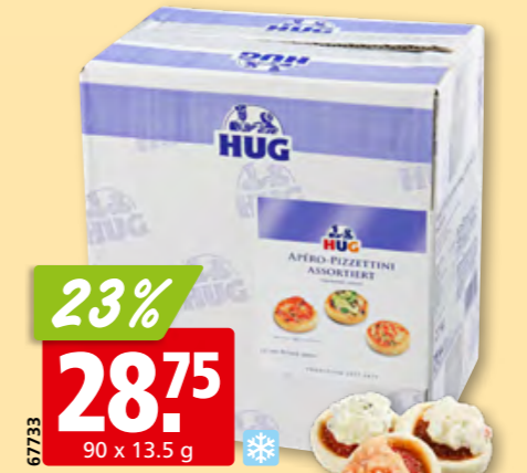
23% 28.75 90 x 13.5 g Apéro-pizzettini Hug assortis, surg.