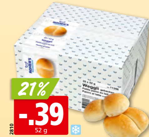
21% -.39 52 g Petit pain au lait Romer's cuit, surg., 25 x