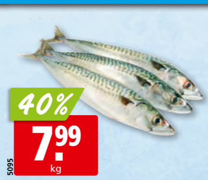
Makrelen frisch, 100-300 g aus dem Nordostatlantik