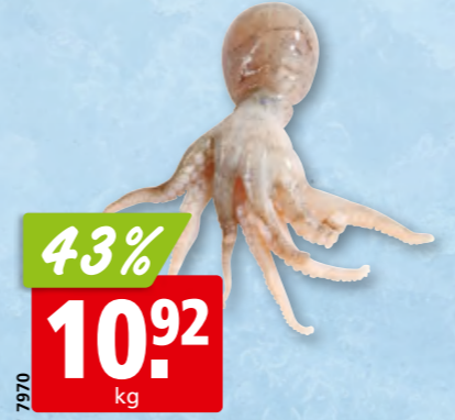
Kleine Tintenfische aufgetaut aus dem Östlichen Indischen Ozean