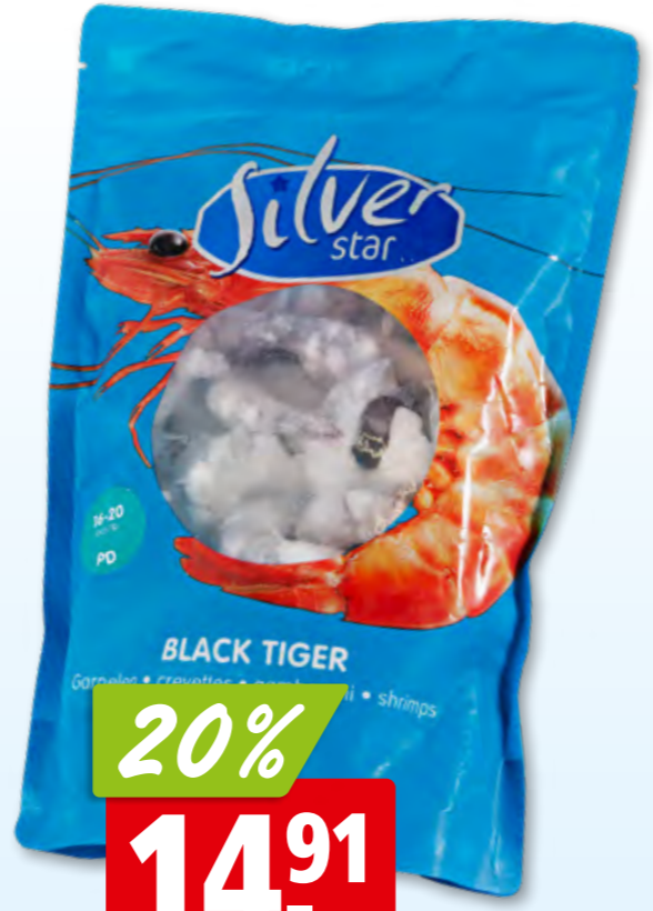
Silver Star Krevettenschwänze Black Tiger, 16-20 geschält, ASC, tk, 10 x