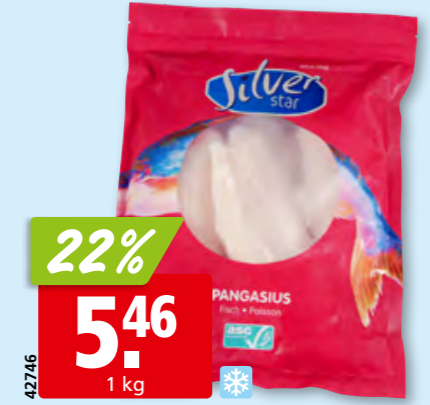
Silver Star Pangasiusfilets nature, 110-170 g ASC, tk, 10 x