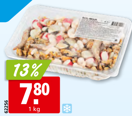
Solimar Meeresfrüchte gemischt tk