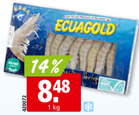
Ecuagold Gambas, 40-60 ganz, ASC, aus Ecuador, tk

Kontakt Anlieferung frischer Fisch ab Dienstag Mittag.