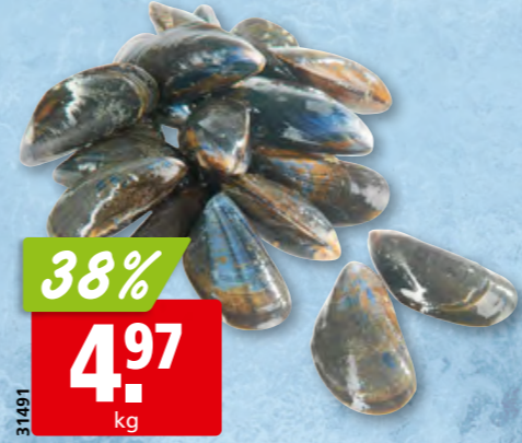
Miesmuscheln Bouchot frisch gereinigt, aus Frankreich