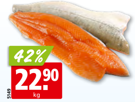
Seesaiblingfilets frisch aus Island