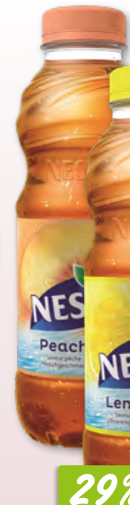
Fusetea Lemon/Lemongrass oder Peach/Hibiscus 24 x