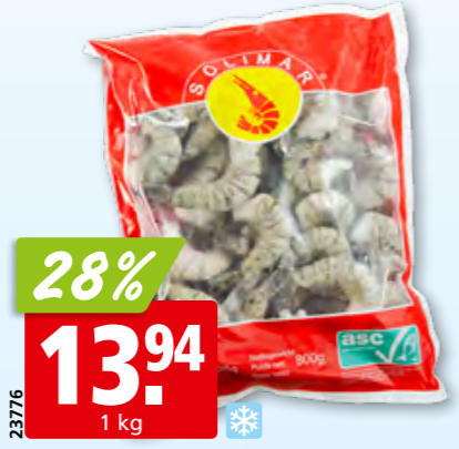
Solimar Krevettenschwänze Black Tiger, 21-25 ASC, tk, 10 x