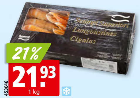
Kaisergranat, 8-12 ganz, tk