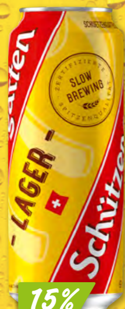
Schützengarten Lager 4 x 6