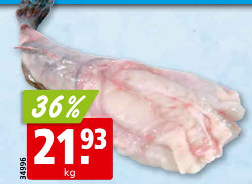
Seeteufel frisch, 1-2 kg aus dem Nordostatlantik