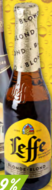
Leffe blond oder braun 24 x