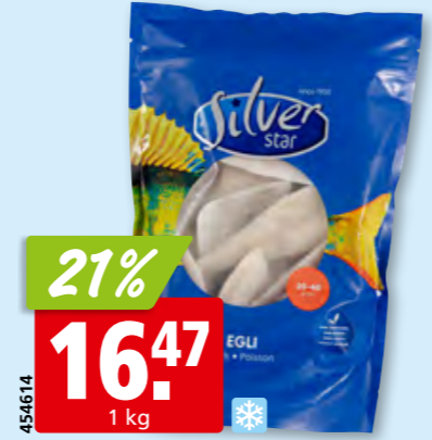
Silver Star Eglifilets IQF mit Haut, 20-40 tk