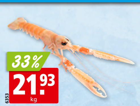
Schottischer Kaisergranat frisch, 16-20 aus dem Nordostatlantik