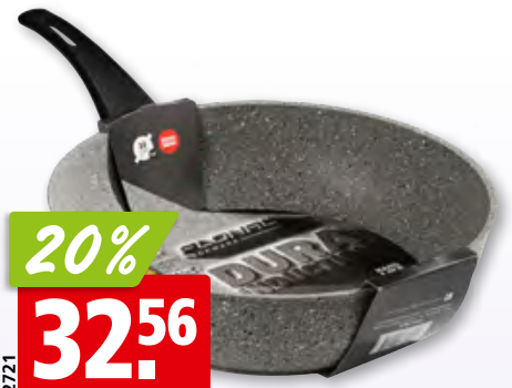
Bratpfanne Lavastein alle Herde, Ø 32 cm