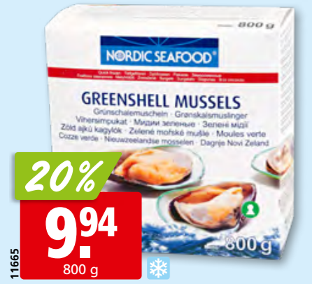
Nordic Seafood halbe Miesmuscheln tk