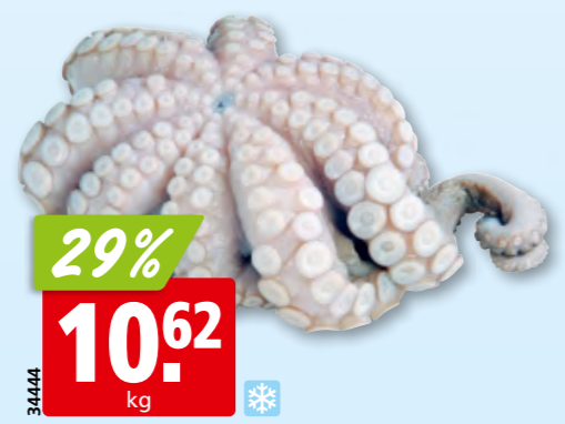
Canosa Tintenfisch, 1-2 kg tk