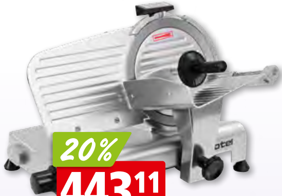
Rotel Profi-Allesschneider Ø 22 cm