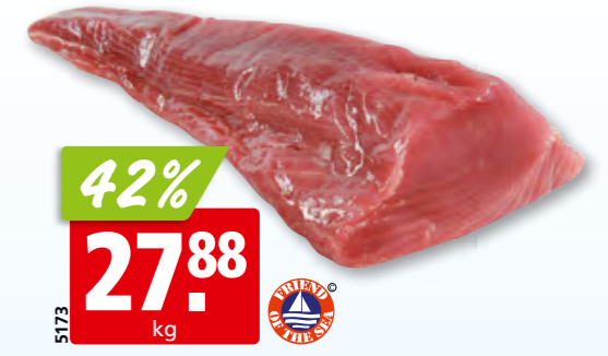
Thunfischfilet frisch aus dem Östlichen Indischen Ozean