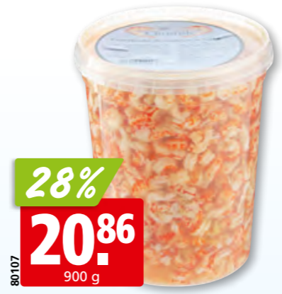
Flusskrebsschwänze in Lake