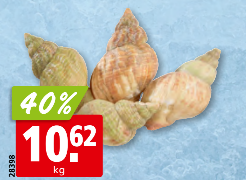
Wellhornschnecken gekocht, aus dem Nordostatlantik