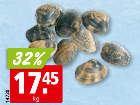
Vongole Veraci frisch gross, aus Italien