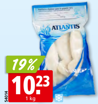
Atlantis Kalmare ganz, gereinigt, tk