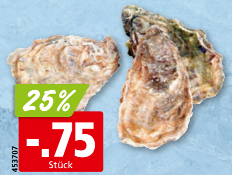
Austern Marennes Oléron Nr. 2 aus Frankreich, 48 x