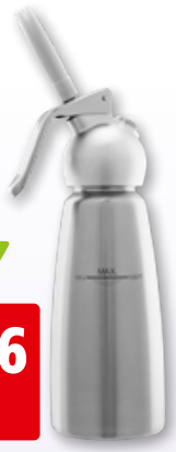
Kisag Whipper Basic 0.5 l