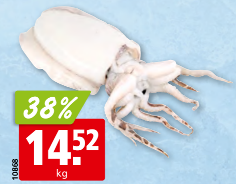
Weisse Sepia aufgetaut aus dem Mittleren Ostatlantik