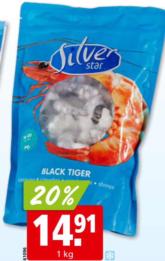
61096 20% 14.91 1 kg Silver Star Krevettenschwänze Black Tiger, 16-20 geschält, ASC, tk, 10 x