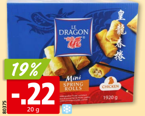
80375 Le Dragon Frühlingsrolle mit Geflügel tk, 96 x