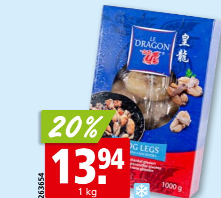
263654 20% 13.94 1 kg Le Dragon Froschschenkel, 30-40 tk, 10 x