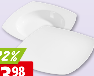
Teller Genova flach 26 cm oder tief 22 cm aus Porzellan, 6 x