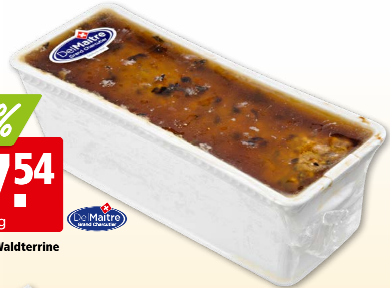
60505 Del Maitre Waldterrine ca. 1.4 kg