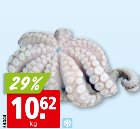
34444 29% 10.62 kg Canosa Tintenfisch, 1-2 kg tk