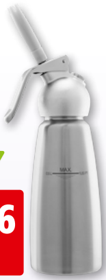
Kisag Whipper Basic 0.5 l