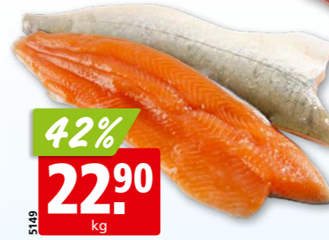
5149 42% 22.90 kg Seesaiblingfilets frisch aus Island