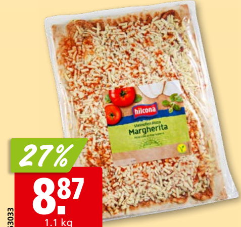
63033 Hilcona Pizza Margherita Family