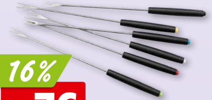
Fleischfonduegabel 6 x