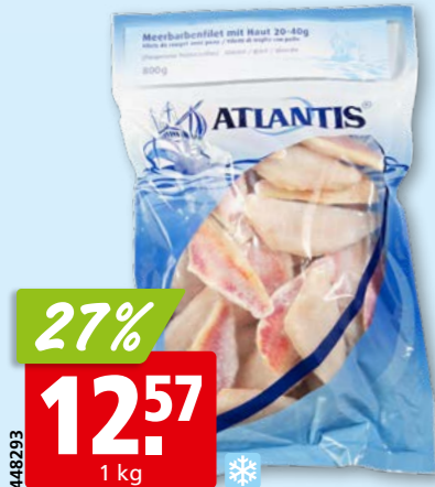
448293 27% 12.57 1 kg Atlantis rote Meerbarbenfilets, 20-40 g mit Haut, tk