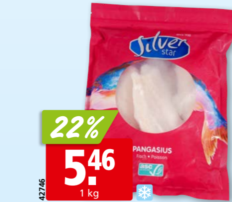
42746 22% 5.46 1 kg Silver Star Pangasiusfilets nature, 110-170 g ASC, tk, 10 x