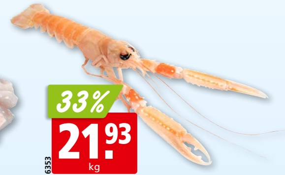
6353 33% 21.93 kg Schottischer Kaisergranat frisch, 16-20 aus dem Nordostatlantik