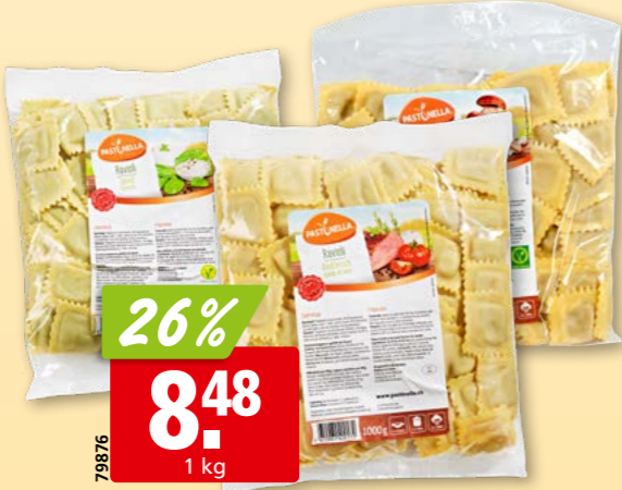
79876 Pastinella Ravioli diverse Sorten