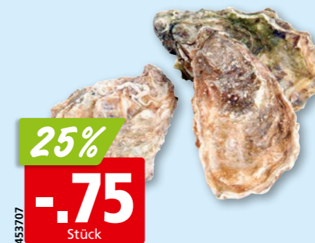
453707 25% -.75 Stück Austern Marennes Oléron Nr. 2 aus Frankreich, 48 x