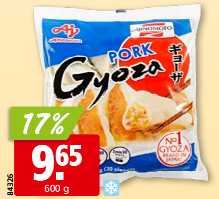
84326 Ajinomoto Gyoza mit Schweinefleisch tk