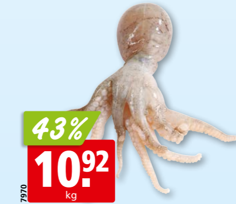
7970 43% 10.92 kg Kleine Tintenfische aufgetaut, aus dem Östlichen Indischen Ozean