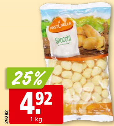
29282 Pastinella Gnocchi