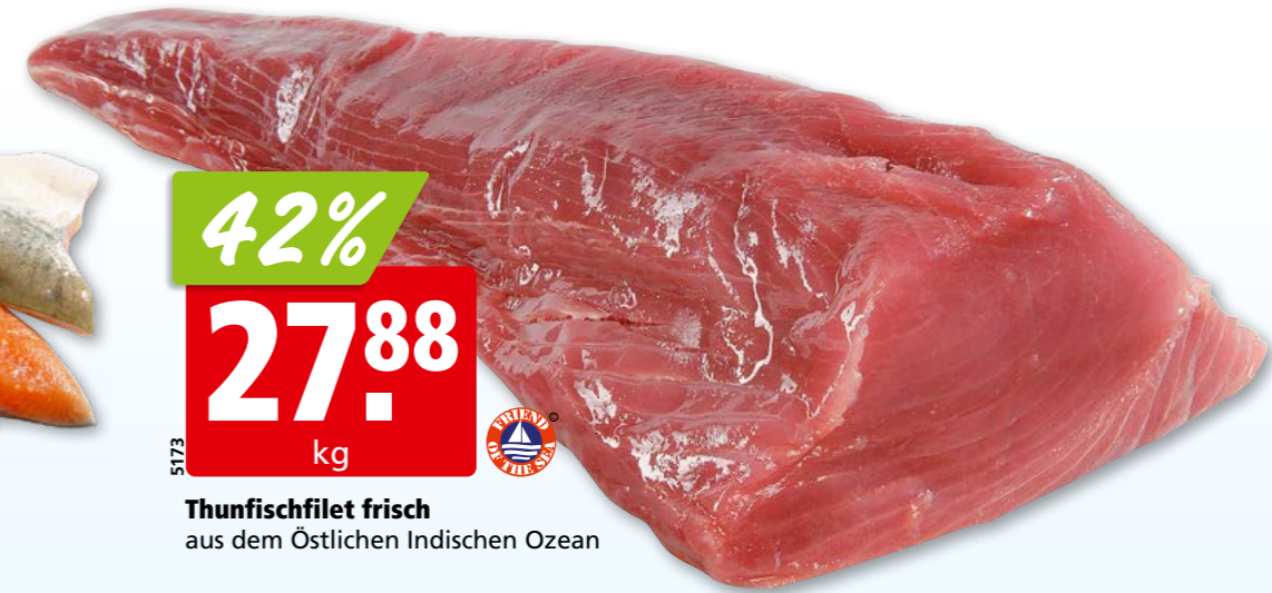
5173 42% 27.88 kg Thunfischfilet frisch aus dem Östlichen Indischen Ozean