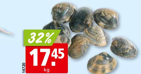
14720 32% 17.45 kg Vongole Veraci frisch gross, aus Italien