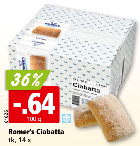
61626 Romer's Ciabatta tk, 14 x