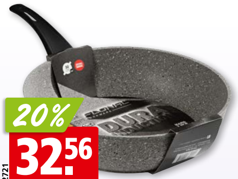
Bratpfanne Lavastein alle Herde, Ø 32 cm