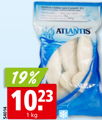
54014 19% 10.23 1 kg Atlantis Kalmare ganz, gereinigt, tk