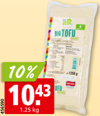
456590 Hilcona Tofu nature Bio