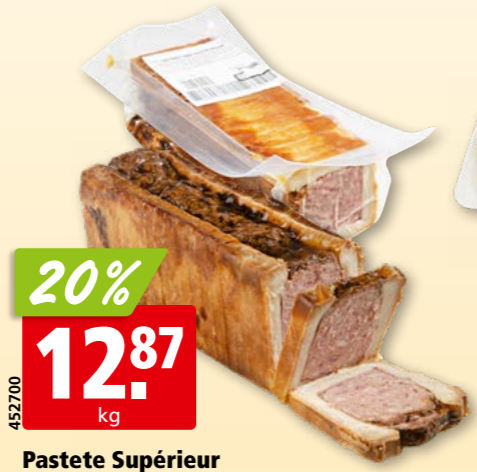
452700 Pastete Supérieur geschnitten, 20 x 60 g