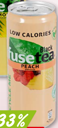
Fusetea Lemon/Lemongrass oder Peach/Hibiscus 33 cl 24 x