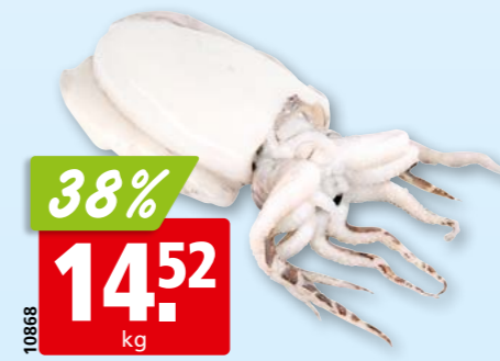
10868 38% 14.52 kg Weisse Sepia aufgetaut, aus dem Mittleren Ostatlantik