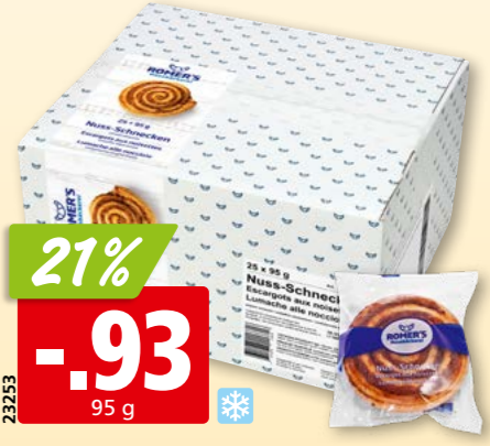
23253 Romer's Nuss-Schnecke tk, 25 x