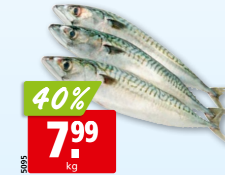
5095 40% 7.99 kg Makrelen frisch, 100-300 g aus dem Nordostatlantik