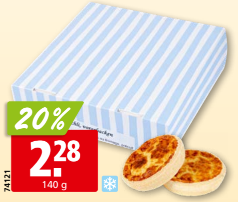
74121 Kern & Sammet Chäschüechli tk, 8 x