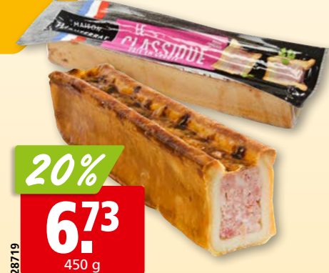
28719 Maison Monterrat Fleischpastete Cocktail nature