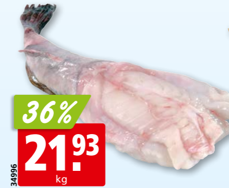
34996 36% 21.93 kg Seeteufel frisch, 1-2 kg aus dem Nordostatlantik