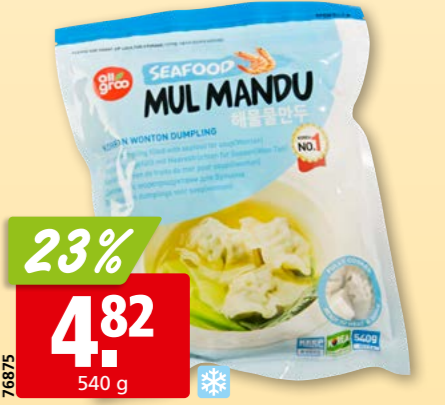
76875 All Groo Wonton mit Meeresfrüchte tk