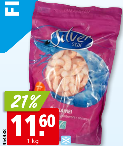
454438 21% 11.60 1 kg Silver Star Cocktail-Krevetten Vannamei 60-90 ASC, tk

Anlieferung frischer Fisch ab Dienstag Mittag.