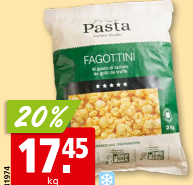
81974 Prima Pasta Fagottini Tartufo tk, 2 kg