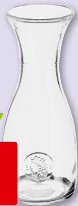
Krug Italia geeicht 1 l