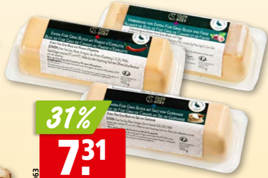
69063 Clos Saint Sozy Enten-Foie gras diverse Sorten