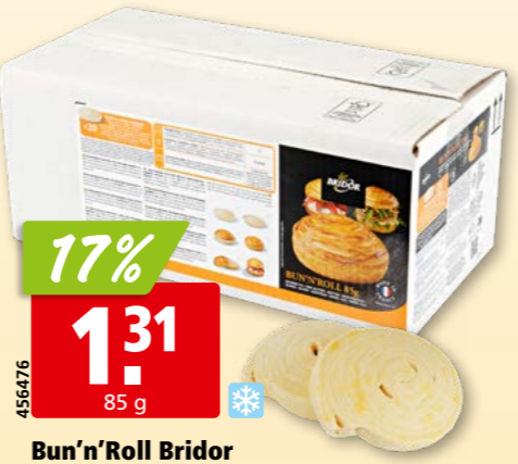
456476 Bun'n'Roll Bridor tk, 20 x