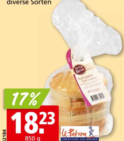
82184 Le Patron Pain Surprise