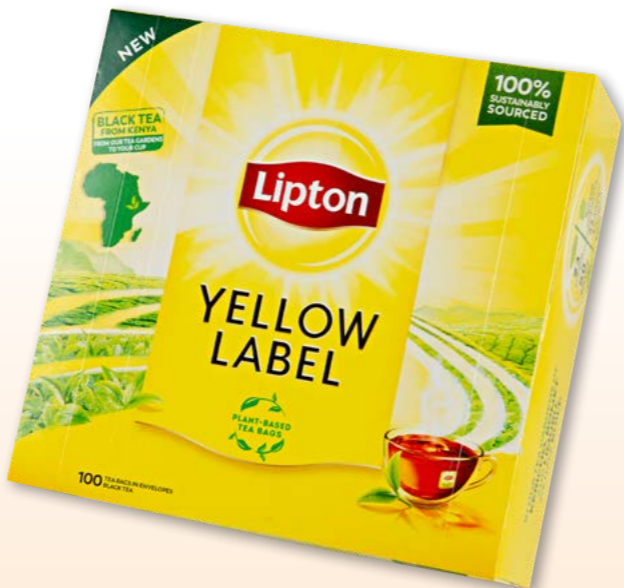
Lipton Yellow Label einzeln verpackt