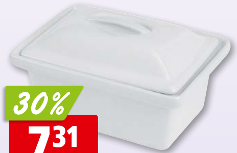
Terrinenform mit Deckel aus Porzellan, 250 ml