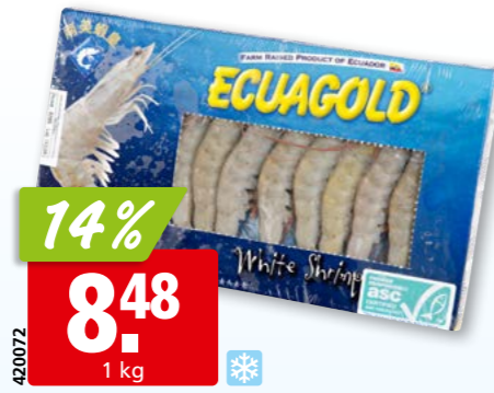
420072 14% 8.48 1 kg Ecuagold Gambas, 40-60 ganz, ASC aus Ecuador, tk