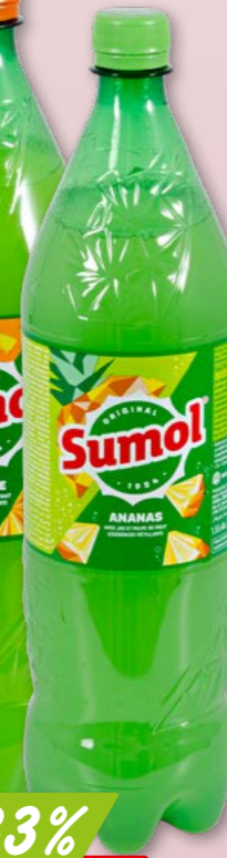
Sumol Orange oder Ananas 1.5 l 6 x