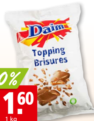
Daim Topping gebrochen