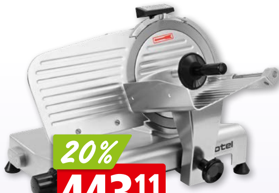
Rotel Profi-Allesschneider Ø 22 cm