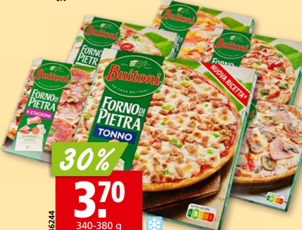
46244 Buitoni Pizza Forno di Pietra diverse Sorten, tk