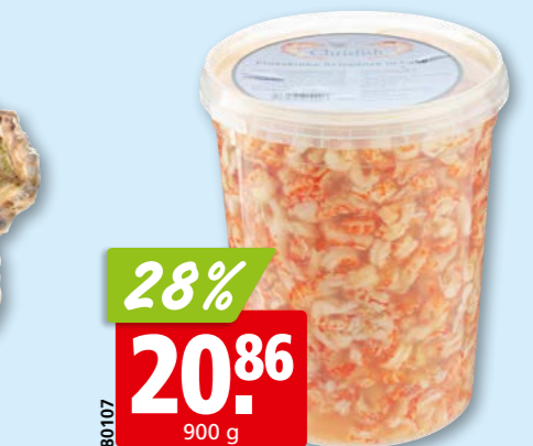
80107 28% 20.86 900 g Flusskrebsschwänze in Lake