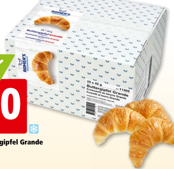
3776 Romer's Buttergipfel Grande tk, 25 x