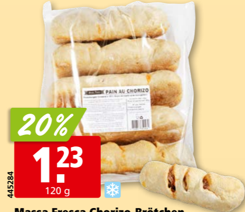
445284 Massa Fresca Chorizo-Brötchen tk, 5 x