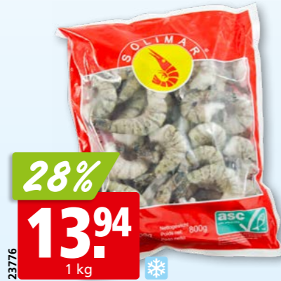
23776 28% 13.94 1 kg Solimar Krevettenschwänze Black Tiger, 21-25 ASC, tk, 10 x