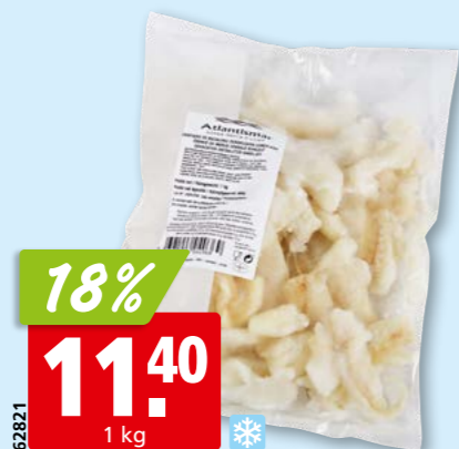
62821 18% 11.40 1 kg Stockfisch-Geschnetzeltes entsalzt, tk