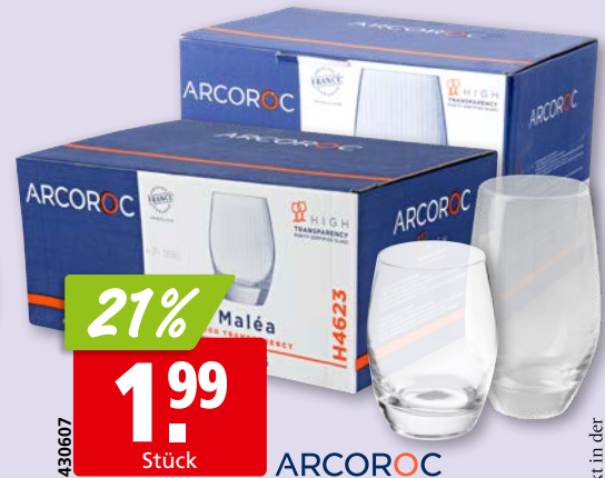
Becher Malea Longdrink 30 cl oder 35 cl, 6 x