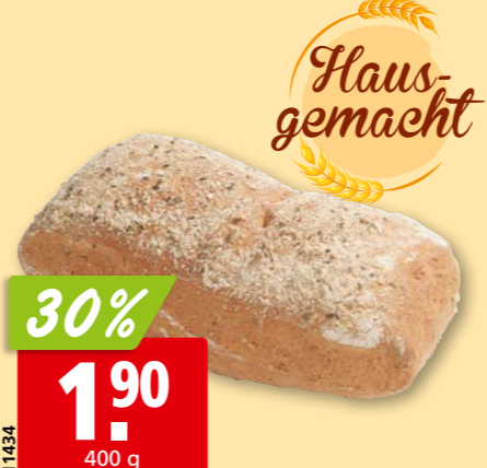
11434 Provenzalisches Brot aus unserer Hausbäckerei