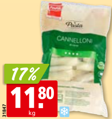
31847 Cannelloni à la viande Findus surg., 2 kg