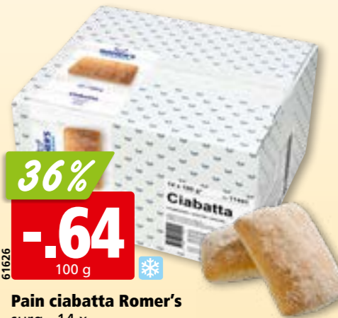
61626 Pain ciabatta Romer's surg., 14 x