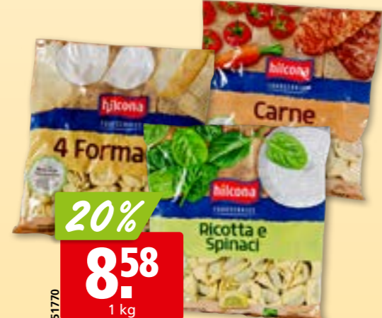
51770 Pâtes farcies Hilcona diverses sortes