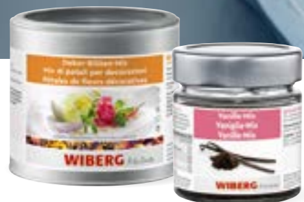
Pétales de fleurs décoratives flower power pour les sens