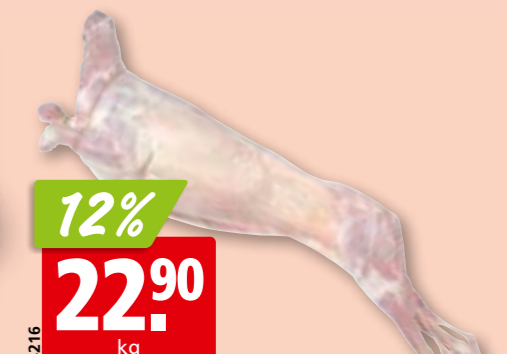
Jarret d'agneau de Nouvelle-Zélande/Australie/Irlande surg.