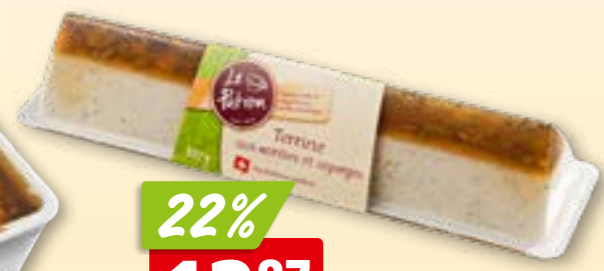
445044 Terrine aux morilles et asperges Le Patron