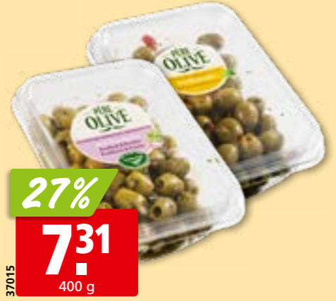
37015 Olives vertes Père Olive à l'ail ou à la provençale