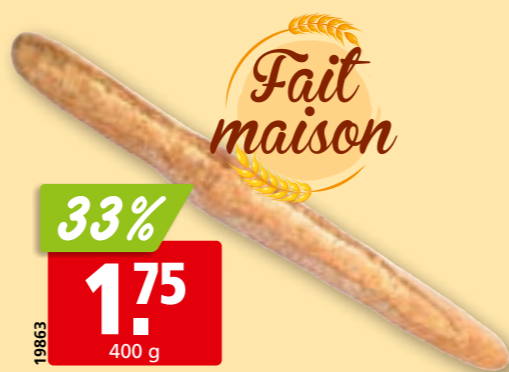
19863 Baguette aux céréales de notre boulangerie artisanale