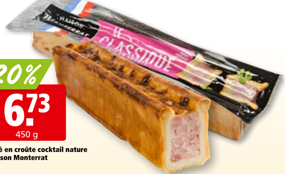
28719 Pâté en croûte cocktail nature Maison Monterrat