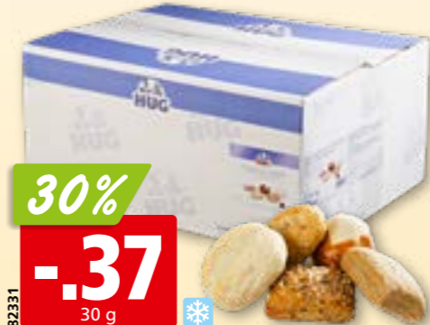
82331 Miniballon Hug 5 sortes, surg., 100 x