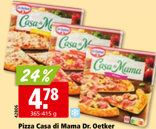
42806 Pizza Casa di Mama Dr. Oetker diverses sortes, surg.