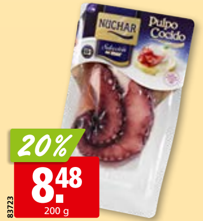
83723 Tentacules de poulpe Nuchar cuits