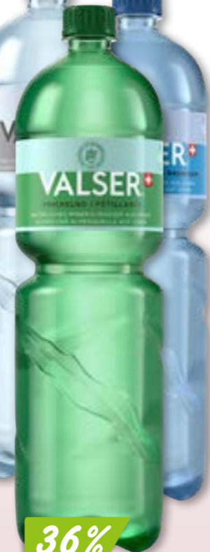
Eau Valais naturelle ou pétillante 4 x 6