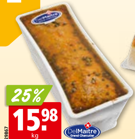
29867 Terrine au poivre vert Del Maître env. 1.6 kg