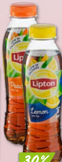
Lipton peach ou lemon 24 x