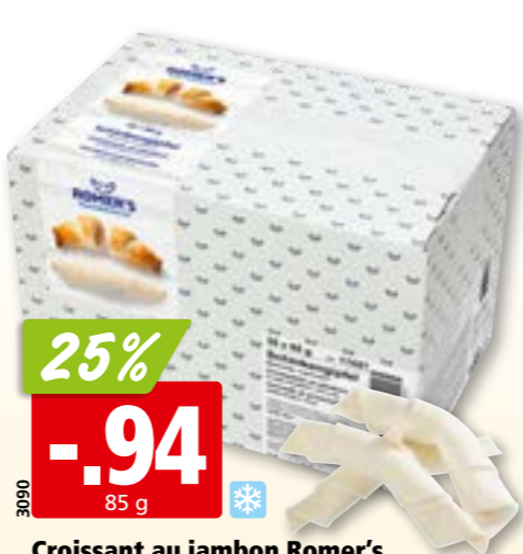
3090 Croissant au jambon Romer's surg., 35 x