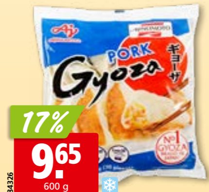
84326 Gyoza au porc Ajinomoto surg.