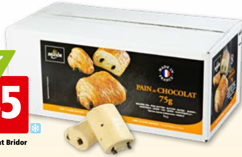
69509 Pain au chocolat Bridor surg., 20 x