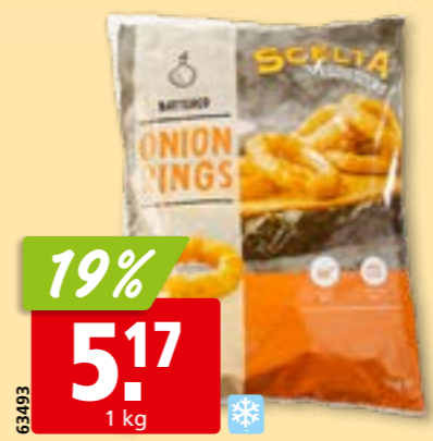
63493 Rondelles d'oignons Scelta panées, surg.