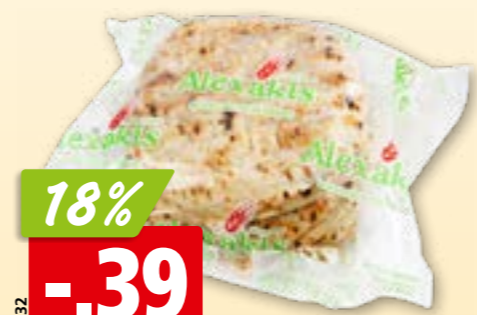
451332 Pain pita Alexakis surg., 10 x