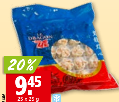
3466 Ravioli chinois shao mai Le Dragon surg.