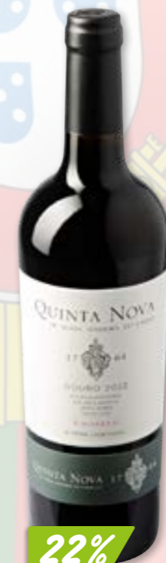
Douro Pomares Quinta Nova DOC 2021, 6 x