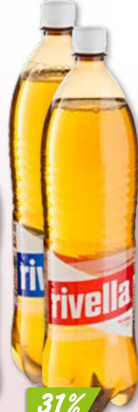
Rivella rouge ou bleu 24 x