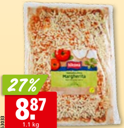
63033 Pizza family Margherita Hilcona