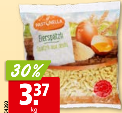
54390 Spätzli aux œufs Pastinella 2 kg