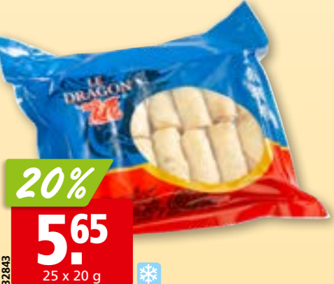
32843 Rouleaux de printemps aux légumes Le Dragon, surg.