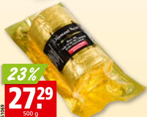
51069 Bloc de foie gras de canard Diamant Noir avec 30% de morceaux